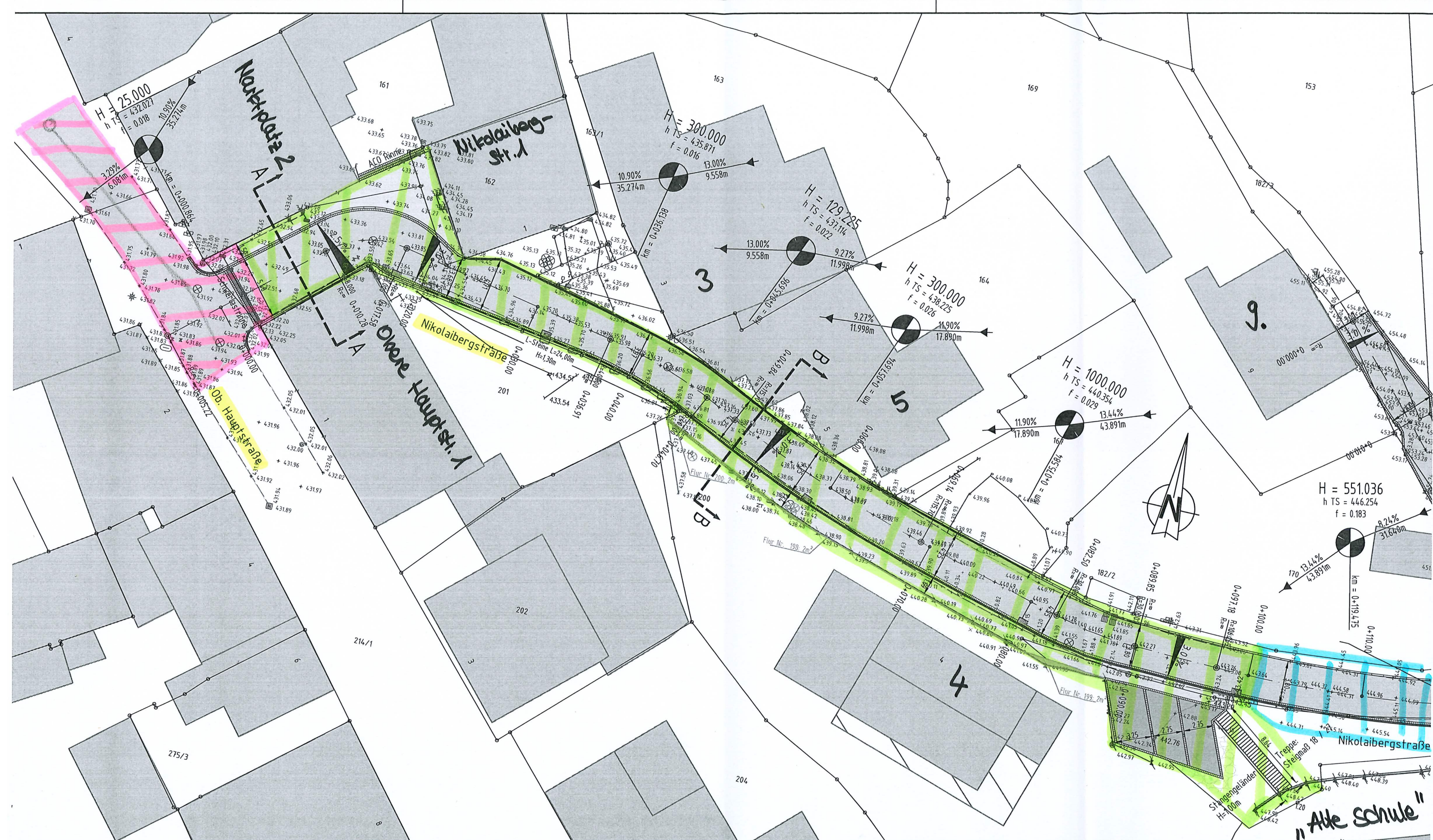
Plan Nr. 01 - Bauabschnitte 04.03.2026